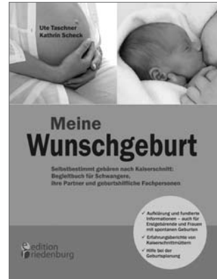
Meine Wunschgeburt Selbstbestimmt gebären nach Kaiserschnitt: Begleitbuch mit Erfahrungsberichten