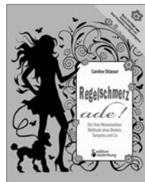
Regelschmerz ade! Die freie Menstruation