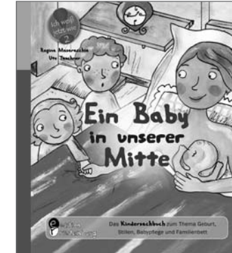
[2] Ein Baby in unserer Mitte – Geburt, Stillen, Babypflege und Familienbett