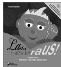
Lass es raus! Die freie Geburt