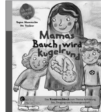
[1] Mamas Bauch wird kugelrund – Aufklärung, Sex, Zeugung und Schwangerschaft

Die Sachbuchreihe Für alle Kinder, die einfach noch mehr wissen wollen.