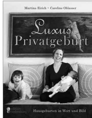
Luxus Privatgeburt Hausgeburten in Wort und Bild • Das große Fotobuch •