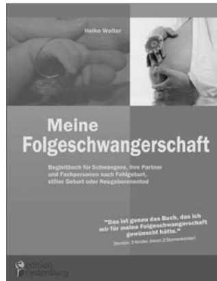
Meine Folgeschwangerschaft Begleitbuch für Schwangere, ihre Partner und Fachpersonen nach Fehlgeburt, stiller Geburt oder Neugeborentod