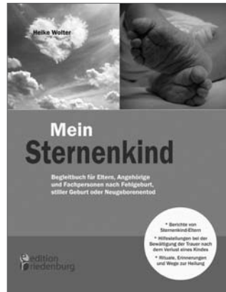
Mein Sternenkind Begleitbuch für Eltern, Angehörige und Fachpersonen nach Fehlgeburt, stiller Geburt oder Neugeborentod