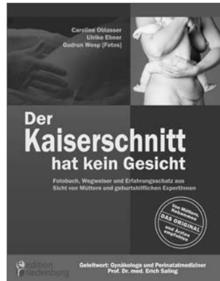
Der Kaiserschnitt hat kein Gesicht Fotobuch, Wegweiser und Erfahrungsschatz zur Sectio