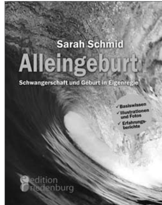
Alleingeburt Schwangerschaft und Geburt in Eigenregie Basiswissen • Fotos • Erfahrungen