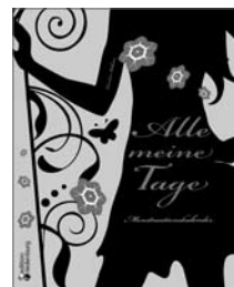
Alle meine Tage Menstruationskalender