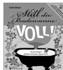
Still die Badewanne voll! Das freie Säugen