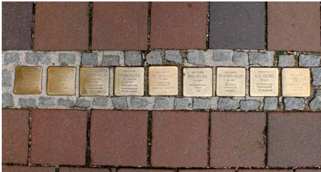
Die Stolpersteine der Familie Holzer in Freising im Juni 2019, Obere Hauptstraße 9