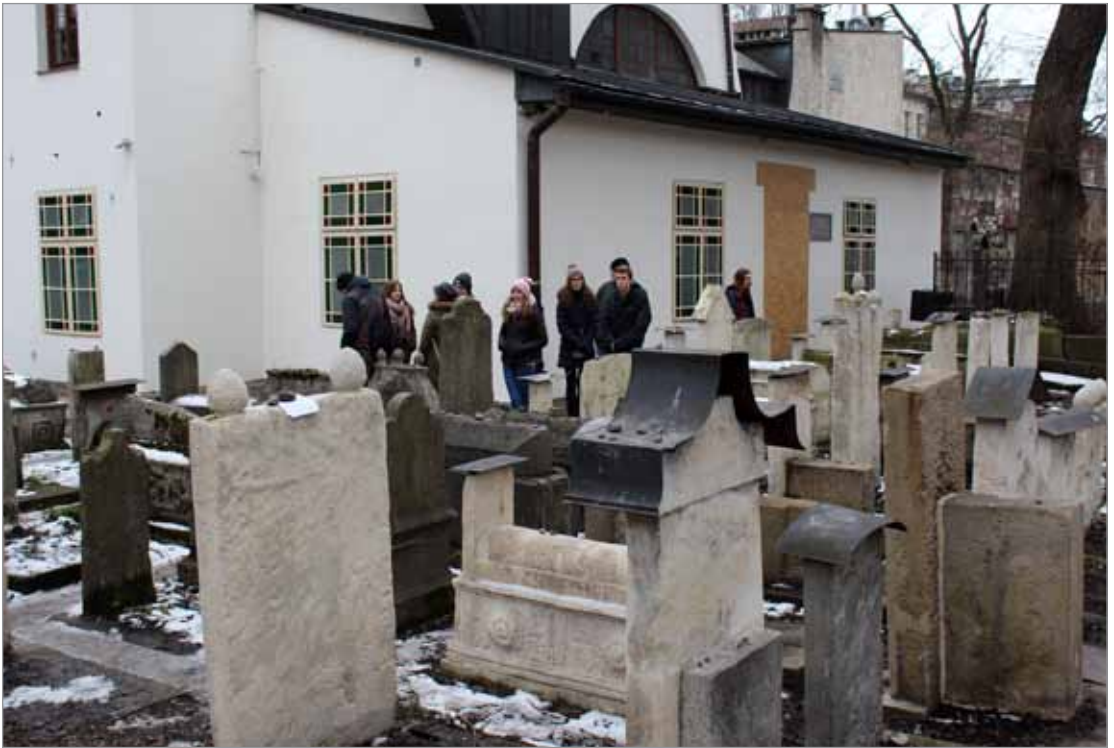
SchülerInnen im Februar 2018 auf dem jüdischen Friedhof in Krakau (jüdisches Viertel Kazimierz).